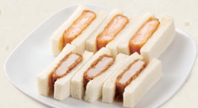
ミックスサンド(ヒレ・エビ) [各3切] 925円(税込1,017円)