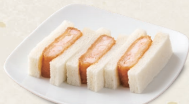
エビかつサンド [3切] 490円(税込539円)