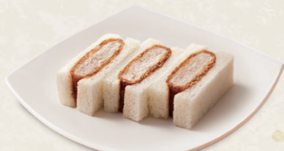
ヒレかつサンド [3切] 450円(税込495円) [6切] 885円(税込973円)