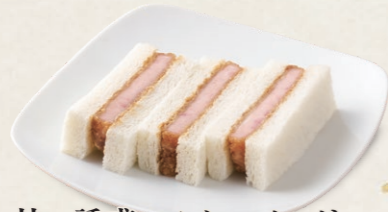
甘い誘惑ハムかつサンド [3切] 460円(税込506円)