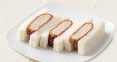
メンチかつサンド [3切] 400円(税込440円)