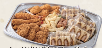
サンド/揚げものオードブル 一口ヒレかつ・海老フライ・クリームコロッケ ウインナー・ハーフサンド・フレンチポテト 6,200円(税込6,820円)~