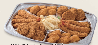
揚げものオードブル 一口ヒレかつ・海老フライ・クリームコロッケ フレンチポテト 5,050円(税込5,555円)~