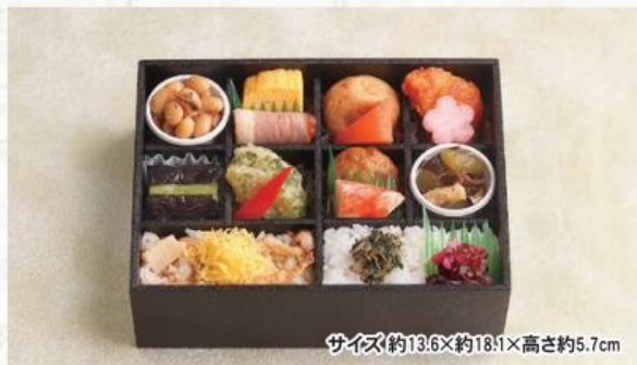
サイズ約13.6×約18.1×高さ約5.7cm