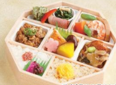
サイズ 約19.2×約19.2×高さ約5.4cm