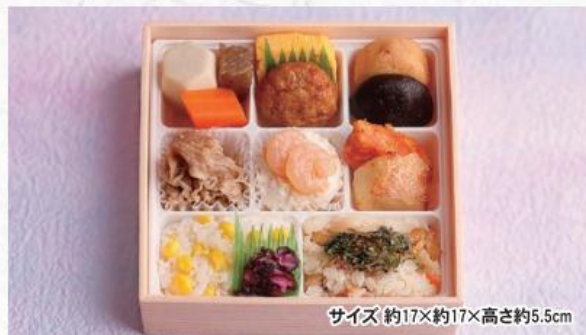
サイズ約17×約17×高さ約5.5cm