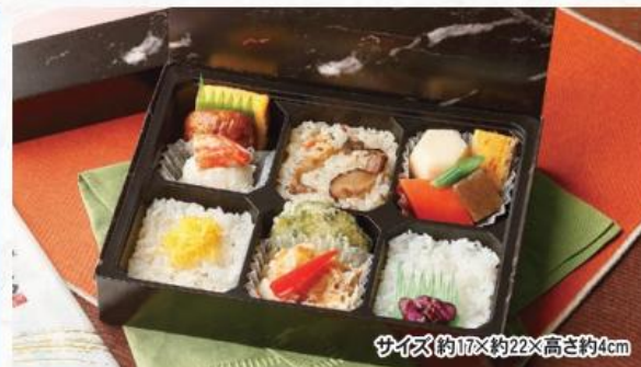
サイズ約17×約22×高さ約4cm