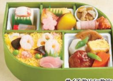
サイズ 約15.5×約20×高さ約5.5cm

2種の御飯と多彩な料理をお詰めしたお弁当。 黒の折箱でフォーマルなお席にご好評いただいております。