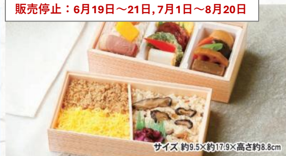
サイズ約9.5×約17.9×高さ約8.8cm

特製の西京味噌に漬け込み、ふっくらやわらかく丁寧に焼き上げた西京焼と、じっくりと味を浸み込ませた鰯の美味しさをお楽しみください。