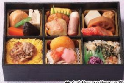
サイズ 約15.4×約22.5×高さ約5.7cm