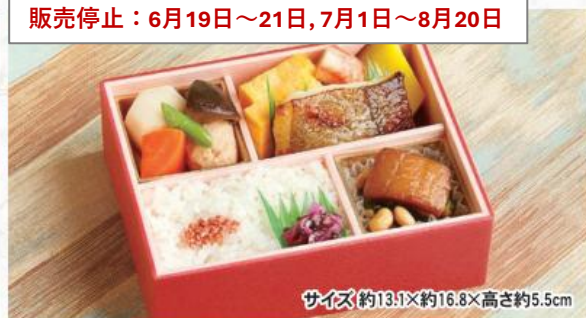
サイズ約13.1×約16.8×高さ約5.5cm

なだ万定番人気の牛肉香味焼、豚肉しぐれ煮を白御飯の上のにせたお弁当です。鶏つくね焼など様々なお肉料理をお楽しみいただけます。