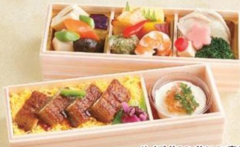
サイズ 約7.6×約21.6×高さ約12cm

赤魚西京焼や鱈南蛮漬などの魚料理をはじめ、揚げ物や煮物、ちらし寿司を詰め合わせたお弁当です。