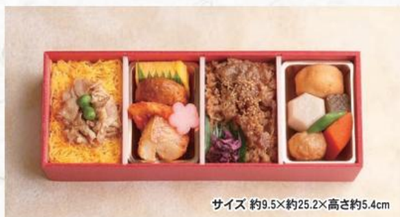
サイズ約9.5×約25.2×高さ約5.4cm

3種の御飯でボリュームもたっぶりのお弁当。御飯が進む、生姜が効いたしぐれ煮と出汁を含んだ煮物をお詰めしました。