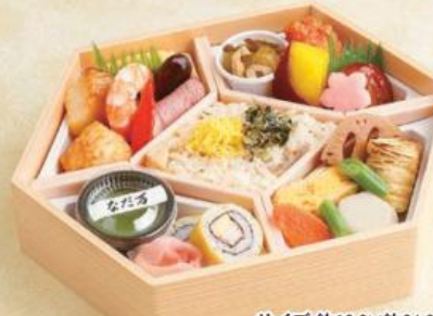
サイズ 約18.8×約24.8×高さ約6cm

2段の折箱に、多彩な料理とうなぎ蒲焼が入った華やかでおもてなしにおすすめのお弁当です。